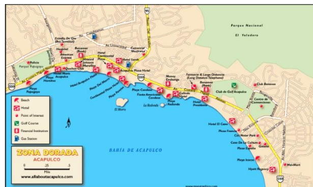
Mapa 1: Ubicación Zona Dorada de Acapulco.

La investigación se llevó a cabo en el municipio de Acapulco, Guerrero; únicamente en el área que comprende la Zona Dorada. Durante el levantamiento y búsqueda de información relacionada al tema, se tomaron en cuenta los acontecimientos de violencia acontecidos en los últimos cinco años, que han sufrido las empresas PST y las fuerzas de seguridad, de la ciudad de Acapulco, como se observa en el siguiente mapa.