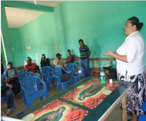
Figura 3 Presentación con principales

En los talleres de planeación se cita a los principales, pues desde los usos y costumbres de la comunidad son todas aquellas personas que han representado a las comunidades o han brindado servicio o que por su edad son personas que pueden aportar y tomar decisiones en las comunidades.