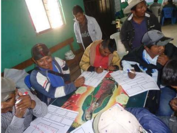
Figura 8 Taller de planeación