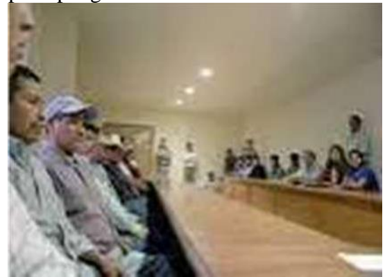
Figura 17 Reunion solución conflicto agrario