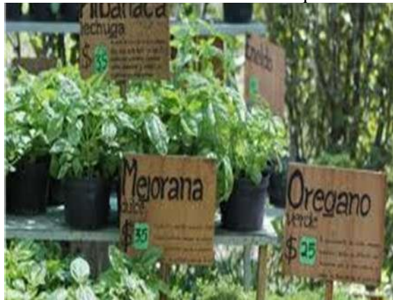
Figura 11 Propuesta farmacia viviente

En el largo plazo un manejo sustentable de sus recursos, con fuentes de empleo permanentes, y un cuidado y respeto por la fauna local, pago por servicios hidrológicos permanentes y áreas destinadas a conservación del bosque.