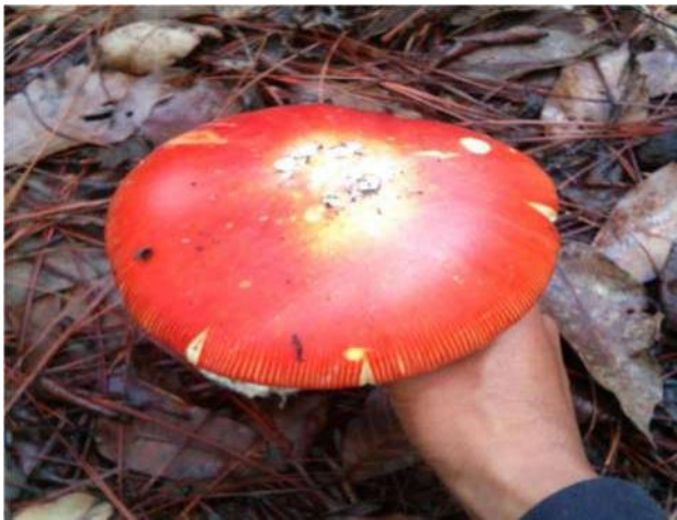
Figura 6 Hongos silvestres

En este sentido se aprecia la presencia de una ganadería incipiente con razas criollas de muy bajo peso en las familias se tiene el manejo en traspatio de ganado menor y de aves de corral con los que las amas de casa contribuyen a la nutrición familiar.