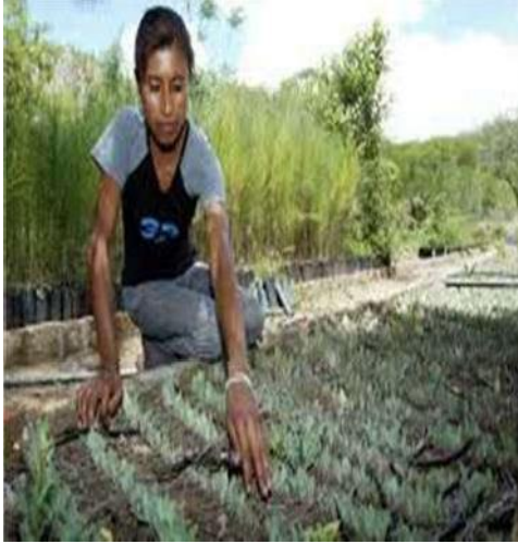
Figura 15 Trabajo para la mujer