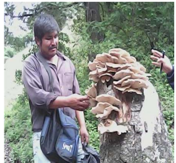
Figura 14 Colecta de hongos