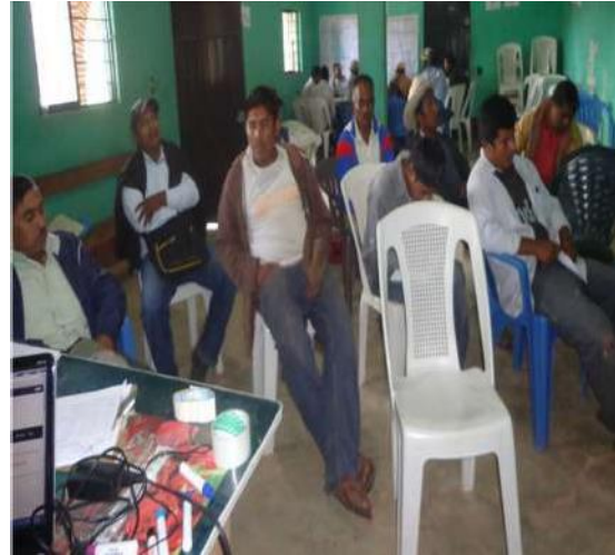
Figura 1 Reunión de planeación

Coadyuvar en el diseño de un plan de acción comunitario basado en la metodología de evaluación rural participativa que permee la gestión social en el núcleo agrario de San Juan Bautista Coapala Municipio de Atlixac