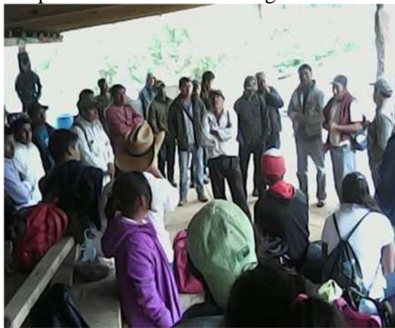
Figura 13 participación comunitaria