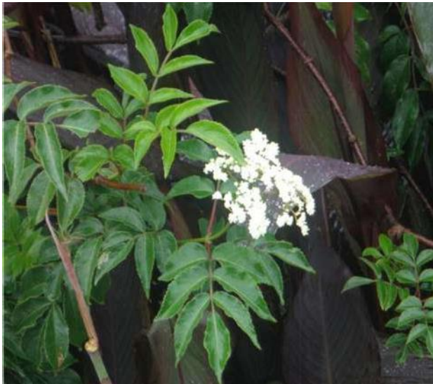
Figura 5 Flor de tila