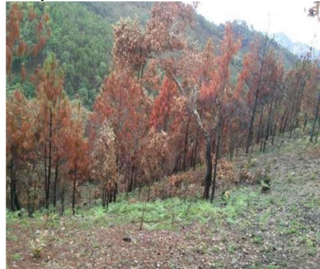
Figura 4 Arboles incendiados

Como primera actividad se inicia la Evaluación rural participativa con la organización de las actividades, fechas y tiempos del diagnóstico y plan con los representantes de las 8 localidades del territorio. En un segundo momento, se realiza el recorrido de transecto con el apoyo de los estudiantes de segundo semestre Huasteco de la carrera de territorio. En desarrollo sustentable, distribuidos en tres rutas con recorridos desde la parte alta hasta las partes más bajas del territorio, donde con el apoyo de entrevistas a actores clave se identifican la vegetación, la fauna, agua, y las actividades económicas, donde a grandes rasgos y generalizando la información se encontró lo siguiente.