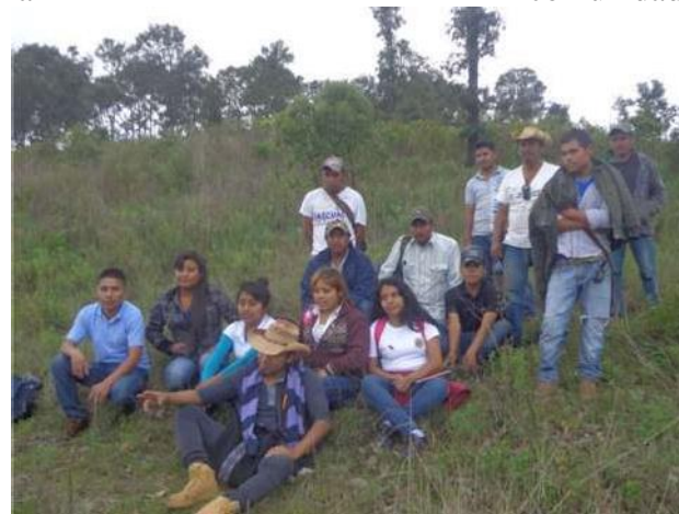
Figura 20 Grupo Huasteco y comunidad

Agradeciendo ampliamente al grupo huasteco de 3er semestre por su participación en una parte fundamental de diagnóstico, y a la Agencia ADERFIEG A. C. por su apoyo en la logística e integración de la información para la comunidad