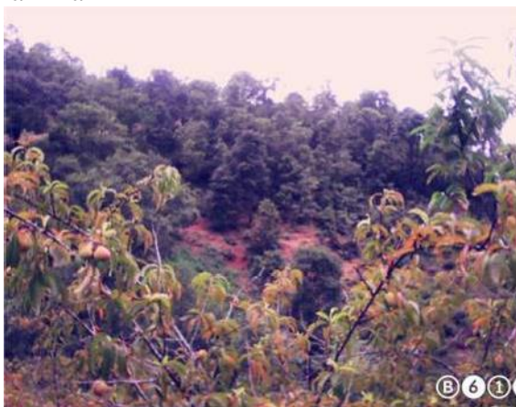
Figura 9 Bosque de encino