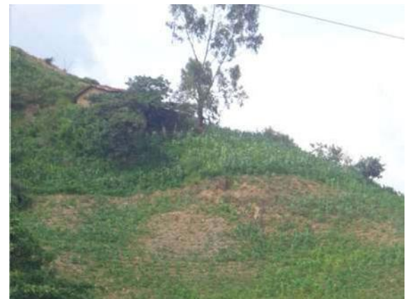
Figura 10 Suelos pobres agrícolas