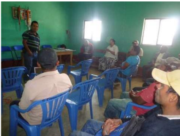
Figura 2 Rep de ADERFIEG A.C.

El documento describe ampliamente como se desarrolla el trabajo en campo y en gabinete hasta la integración general del plan de acciones estratégicas que es el objetivo del núcleo agrario y de la Agencia Aderfie, aunado a lo anterior se desarrolló una propuesta de trabajo, y se analizan las dificultades encontradas para su ejecución