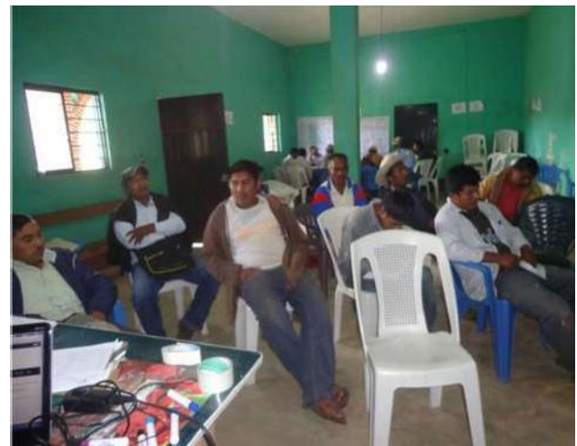
Figura 7 Reunion de organización

Durante el desarrollo de los talleres de diagnóstico y planeación se encontró la siguiente problemática a atender de acuerdo a los ejes físico ambiental, económicos, y sociales.