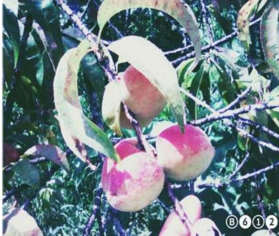
Figura 12 Producción de durazno

Derivado de todo este análisis se genero plan de trabajo.