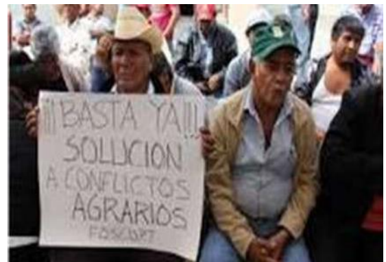
Figura 18 Conflictos