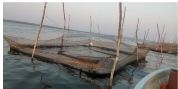
Figura 6. Jaulas artesanales elaboradas por miembros de la comunidad Fuente: tomada en campo: 16/04/2023

En un primer momento, narran los participantes, gran parte de los habitantes recurrieron a las bondades de la laguna para satisfacer las necesidades relacionadas con la alimentación, ante la reducida oferta laboral tuvieron que organizarse (habitantes y pescadores miembros de la sociedad cooperativa “El Amate”) para implementar una serie de proyectos acuícolas. Primero un conjunto de habitantes comenzaron a elaborar jaulas de manera artesanal (Figura 6), el proyecto acuícola inició con la introducción de 30 jaulas en agosto del 2020, posteriormente cada mes se introducían de 15 a 30 jaulas más, al transcurrir el tiempo cada vez más miembros de la localidad se unieron al proyecto pasando de una pesca tradicional al cultivo de tilapia en mayor escala (acuicultura). Dicha actividad cohesionó a la población y a las sociedades cooperativas de la localidad: algunas familias se dedicaron a tejer jaulas y otras a la alimentación y cuidado de los peces.