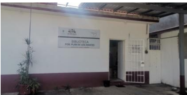
Figura 5. Biblioteca de la comunidad

A su vez, la biblioteca de la comunidad se considera un lugar relevante debido a las actividades escolares y culturales que se organizan para la comunidad, los participantes resaltan que es un lugar donde los niños y jóvenes se reúnen para realizar actividades escolares, además, del círculo de lectura que se lleva a cabo cada jueves en donde se leen cuentos y se realizan diferentes actividades de índole educativa (Figura 5).