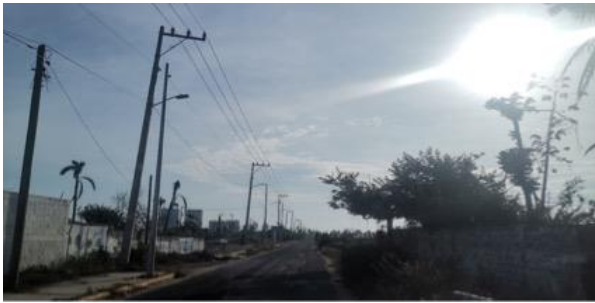
Figura 4. Calle Tampico: entrada principal a la localidad Fuente: tomada en campo: 12/06/2023

Por otro lado, el observable de “Calle Tampico” vislumbró situaciones de despojo hacia algunos ejidatarios y habitantes del lugar debido al establecimiento de desarrollos inmobiliarios, además de la construcción de complejos hoteleros en predios y ejidos cercanos a la comunidad, de esta forma las narraciones resaltaron situaciones de conflictos e injusticias percibidas por los participantes.