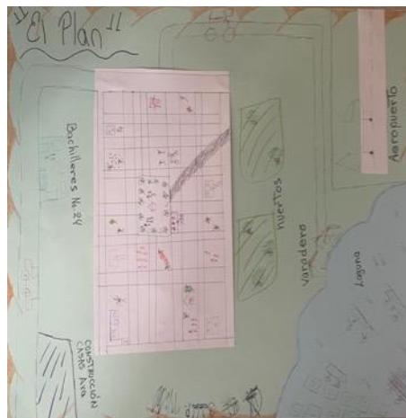
Figura 3. Mapa comunitario