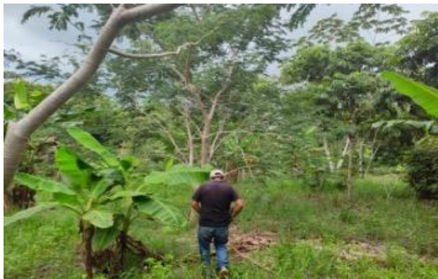
Figura 2. Recorrido guiado por el comisario

Por otro lado, la cartografía social dinamiza una imagen colectiva y a partir de esa dinamización de la memoria y del intercambio de información territorial, facilita una visualización de la dinámica del pasado y el presente (Diez y Rocha, 2016). En ese orden de ideas, la intervención cartográfica se llevó a cabo el día 5 de agosto del 2023, aproximadamente a las 2 de la tarde, se realizó un recorrido por la localidad. Se caminó por las principales calles del lugar con la finalidad de identificar los lugares, elementos vulnerables, cohesivos, los obstáculos y las alternativas de desarrollo que impactan en el territorio y sus habitantes (Figura 2).