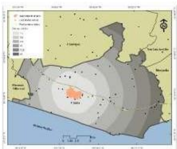
Figura 4. Copala: contexto general