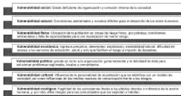
Figura 3. Dimensiones de la vulnerabilidad.

torno a la propuesta de CONEVAL, pues la vulnerabilidad no puede ser definida únicamente a partir indicadores relacionados con la pobreza.