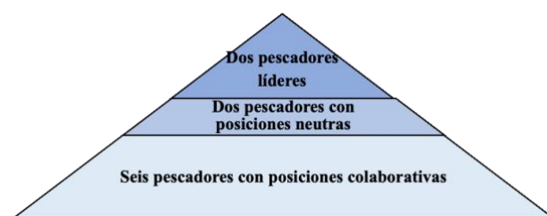
Figura 2. Mapa de actores locales.

Asimismo, se identificaron actores de poder dentro de la comunidad que pueden movilizar y generar acciones en pro de la conservación ambiental del territorio y la laguna de Tres Palos, así como establecer puentes de comunicación con el gobierno local para satisfacer las necesidades de la comunidad; postura que se comparte y fue hallada dentro de los estudios de (Medina-Valdivia et al., 2021). Sin embargo, se encontraron ciertas fuerzas que no permiten la cohesión de la comunidad, a pesar de la existencia de actores que pueden desarrollar un cambio en pro de tener una relación armoniosa con el ambiente, la laguna y la comunidad. En este sentido, el estudio de los actores locales nos permitió identificar los diferentes intereses y perspectivas dentro de la comunidad y cómo estos afectan la conservación de la laguna de Tres Palos, algo parecido ocurre con los estudios de Lozano et al., (2022), donde se exploró las comunidades que tenía que dependencia de agronegocios, existían actores que permitía una agrupación social a nivel rural.