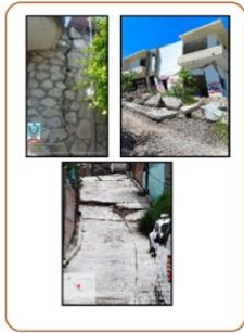
Figura 1: Daños en viviendas e infraestructura en colonias del norponiente de Chilpancingo.

En el presente artículo se muestran los resultados obtenidos tras la estancia de investigación realizada en el verano del periodo junio – julio del año 2024.