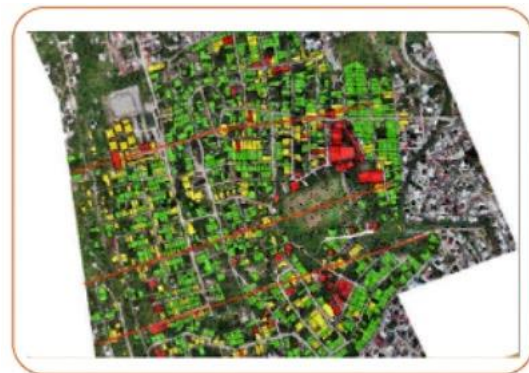
Figura 5. Mapa de la identificación de daños de la zona norponiente (en el mes de septiembre de 2024).

En la siguiente imagen se puede observar el tipo de afectaciones en la zona norponiente; en este caso, por colonias. Puede apreciarse que algunas colonias aún no presentan daños graves, pero con el paso del tiempo y por efectos climatológicos, no se descarta que también se puedan presentar casos de viviendas con daños graves en el mediano plazo, sobre todo, si se considera que el proceso de reptación de la ladera no se ha detenido.