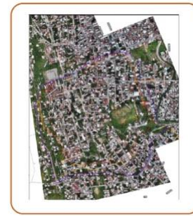
Figura 2: Mapa de identificación de daños del Atlas de Riesgo, año 2021.

En los trabajos para integrar el Atlas de Riesgo de Chilpancingo, Gro; publicado en el año 2021, se realizó una inspección de los daños de la zona norponiente y se propuso un mapa de identificación de daños. Actualmente en la inspección visual realizada por los autores en el mes de septiembre de 2024, se pudo apreciar el avance extraordinario del fenómeno de deslizamiento, con desplazamientos horizontales y verticales en la corona del mismo de hasta 1.4 m y 1.20 m respectivamente, lo que pudiera agravarse en caso de la ocurrencia de un sismo de gran magnitud o de una fuerte precipitación pluvial.