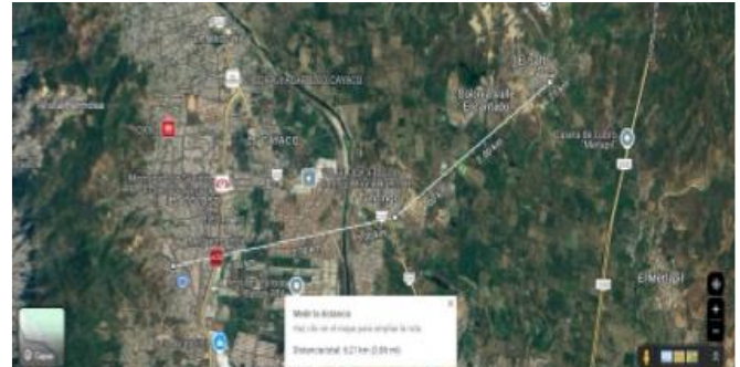
Figura 2. Mapa de conectividad en comunidades Tuncingo y El Salto

problemas como la inseguridad y la falta de infraestructura adecuada, han contribuido al desinterés de las principales empresas proveedoras de servicios de conectividad por invertir en estas localidades, lo que agrava aún más la problemática de conectividad en la región.