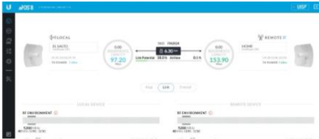
Figura 4. Se representa la comunicación entre la antena principal emisora (Base) y la receptora (El Salto).

pueden modificar ciertas características del funcionamiento del software. Con la comunicación en curso se realizaron pruebas preliminares para desarrollar actividades de red y su funcionamiento, atendiendo principalmente a los Objetivos de Desarrollo Sostenible (ODS) Agenda 2030, en especial la calidad de la educación. Como se muestra a continuación: